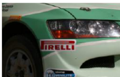
Example of rear and front bumper stripes

Такие места должны оставаться исключительными.