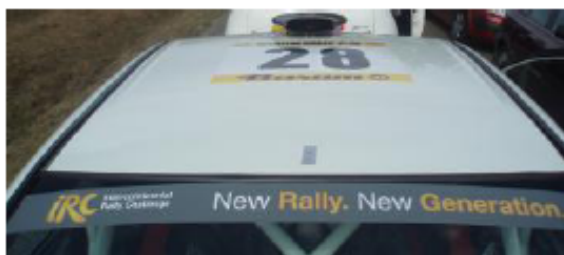
Rear screen stripe